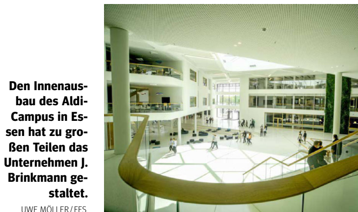
Den Innenausbau des Aldi-Campus in Essen hat zu großen Teilen das Unternehmen J. Brinkmann gestaltet.

Den Trockenbau möchte er als Schlüsselgewerk der Baubranche weiter entwickeln und sieht die eigene Firma eng mit der Oberhausener Wirtschaftsgeschichte verbunden. Der Betrieb liegt auf dem Gelände der früheren Gutehoffnungshütte und inmitten des modernen Baus schaffen Bilder von einst eine Verbindung zur industriellen Vergangenheit.