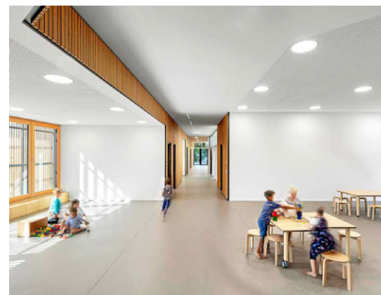
Hell und lichtdurchflutet kommt die Kita Troisdorf daher, für deren Innenausbau das Unternehmen J. Brinkmann einen Preis bekommen hat.